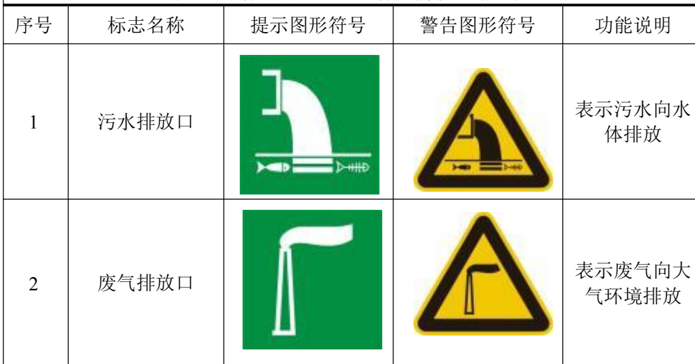
表 5-1 各排污口 (源) 标志牌设置示意图

根据国家标准《环境保护图形标志—排放口 (源)》(GB15562.1-1995)、《环境保护图形标志—固体废物贮存 (处置) 场》(GB15562.2-1995) 和国家生态环境部《排污口规范化整治要求》(试行) 的技术要求, 企业所有排放口 (包括水、气、声、渣) 必须按照“便于采样、便于计量检测、便于日常现场监督检查”的原则和规范化要求, 设置与之相适应的环境保护图形标志牌, 绘制企业排污口分布图, 同时对污水排放口安装流量计, 对治理设施安装运行监控装置、排污口的规范化要符合有关要求。图形符号见下表。